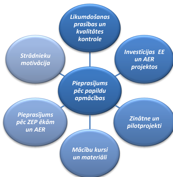
7.1. attēls. Faktori, kas ietekmē pieprasījumu pēc papildu apmācības