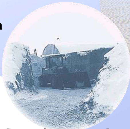
Videi draudzīga siltumapgāde